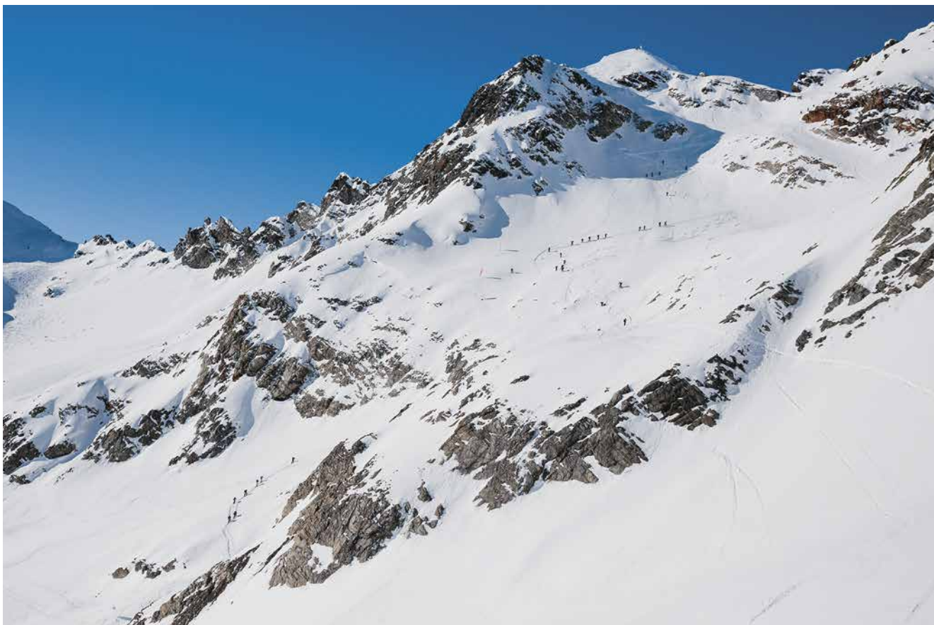
Die vergletscherten Berge der Litzner-Seehorn-Gruppe bieten die perfekte Bühne für einen Free-Touring Contest.

Nächster Event: 23.-25. März 2018 Website: http://bot-freeride.at/ BoT dankt den Sponsoren: Intersport Montafon-Rankweil-Dornbirn, Arc'teryx, Jones Snowboards, Black Crows, Pieps, Illewerke Tourismus, Montafon Tourismus, Contour, SP